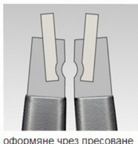
оформяне чрез пресоване