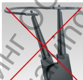
Традиционни зегер клещи: Възможно усукване на пръстена при монтаж